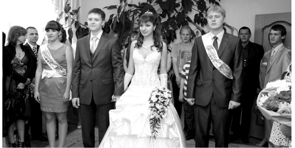
Совет да любовь!

Главное сокровище любого ЗАГСа – архив. Согласно закону, наше правовое состояние – «возникновение, изменение или прекращение прав и обязанностей» – фиксируется именно в органе ЗАГС. В архиве